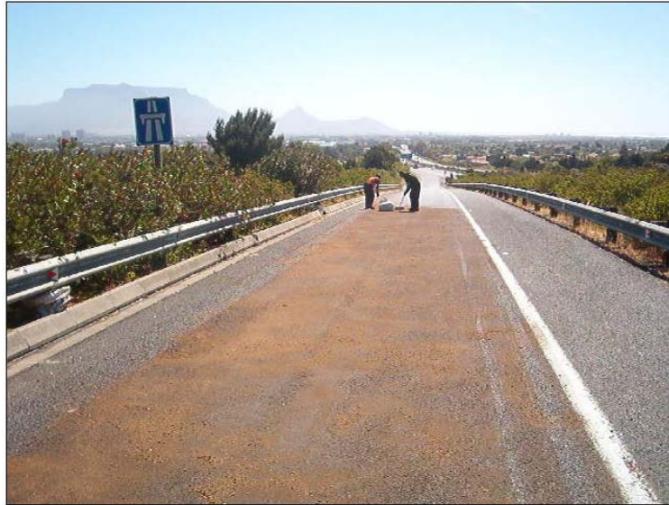
Echando la última mano de biomatrix.