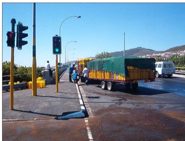
Encharcamiento de diesel en el borde del asfalto junto al bordillo.