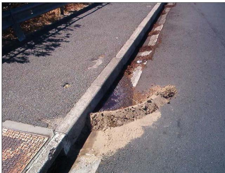
Frenando el vertido en pendiente.