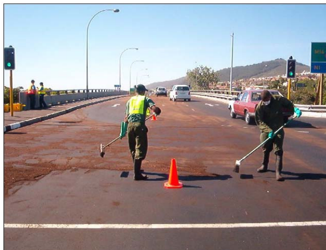
Retirando primera capa de Biomatrix.