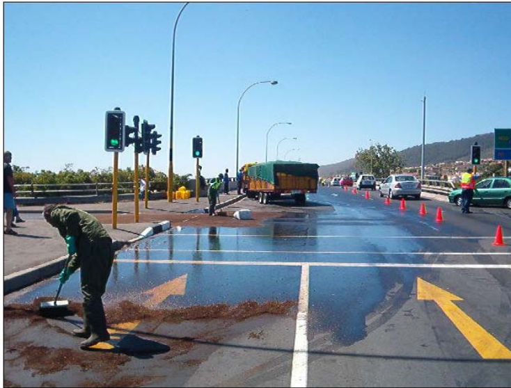
Empezando as labores de absorción.