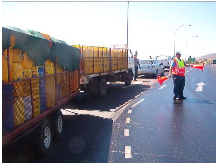
Superficie afectada de diesel en la carretera

-Respuesta de Emergencia; Limpieza de Diesel, Evitar accidentes de trafico, Minimizar operaciones de limpieza/recogida (menor volumen) así como de tiempo/costes; Minimizar el impacto medioambiental.