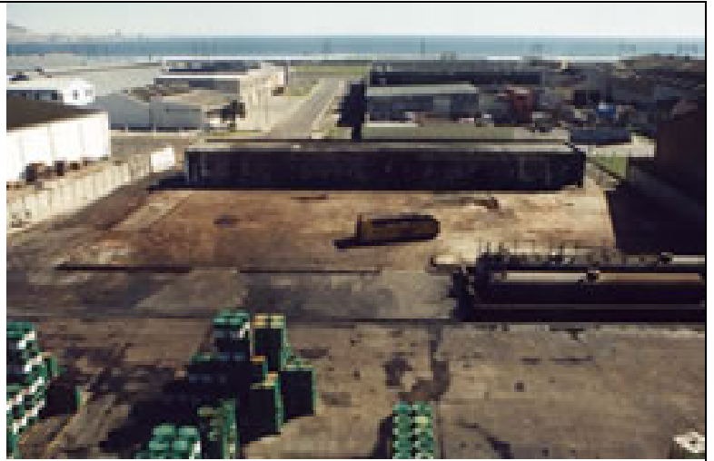
Después de 13 días , el solar vuelve a la normalidad.

Toda la limpieza se realizó en un tiempo record de 13 días, ahorrando costes gracias a la flexibilidad de BMG, utilizándose como un protector de drenaje, supresor de vapores con la capacidad de poder extenderlo por las áreas invadidas de aceite. Esta mejora de la factoría permitió al equipo de demolición desmantelar la estructura del techo de acero dañada por el fuego y trabajar en un entorno mas seguro .