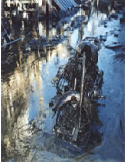
Motocicleta bañada en aceite