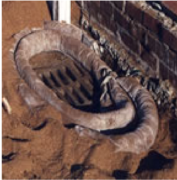
Barrera en una alcantarilla